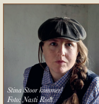
Stina Stoor Kommer

Litteraturhus Lund arrangerar för andra året Novellfest i Lund. Den 10 och 11 september fylls Lunds konsthall och