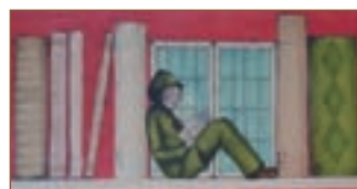
Det mysiga med att läsa ställdes inte in.

Flera av oss från Författarcentrums fyra regioner hade anlänt till Umeå den 11 mars för att ha möten och besöka den internationella litteraturfestivalen Littfest. Vi hade precis hunnit checka in på hotellet när våra kollegor i norr tvingades ta beslutet att ställa in hela festivalen. Då stod det klart att 500 personer inte ska trängas och mingla enligt Folkhälsomyndighetens och regeringens direktiv. Vid den tidpunkten kunde vi ännu inte på fullt allvar föreställa oss att vår egen författardag 19 mars, Mysiga läsdagen i Malmö, fullsatt med 80 lärare från hela södra Sverige, skulle behöva ställas in! Men deltagarna började höra av sig med återbud, de fick inte resa från sina kommuner. Så fick också vi ta beslut att ställa in. Sommarmötet sköts på framtiden.